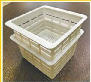
Ручной способ (Штабелируется до 10 штук)