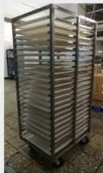
лоток 600x400x25 в стеллаже