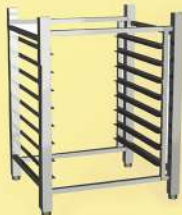
Стеллаж вызревания сыра