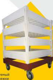
Ящик штабелируемый в мобильной тележке