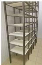
лоток 600x400x25 в стеллаже