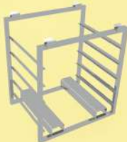
Стеллаж обсушки сыра