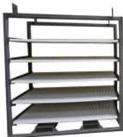
Полка перфорированная в стеллаже КС-450 для сыродельных заводов