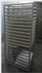
лоток 340x460x25 в стеллаже