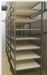
полка 1000x905x20 в стеллаже