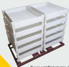
Ящик штабелируемый в рамке для погрузчика или даже ручной рохли